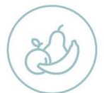
Regelmäßig frisches Obst