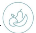
Regelmäßig frisches Obst